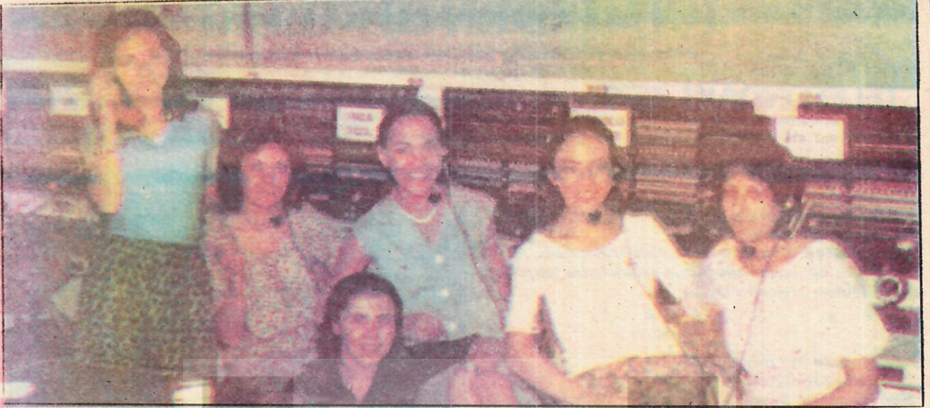
Santral memureleri abonelerden, aboneler de santral memurelerinden yakınıyorlar.

ARAYIŞ — Sizler, 657 sayılı Devlet Memurları Yasası'na bağlı değil misiniz?