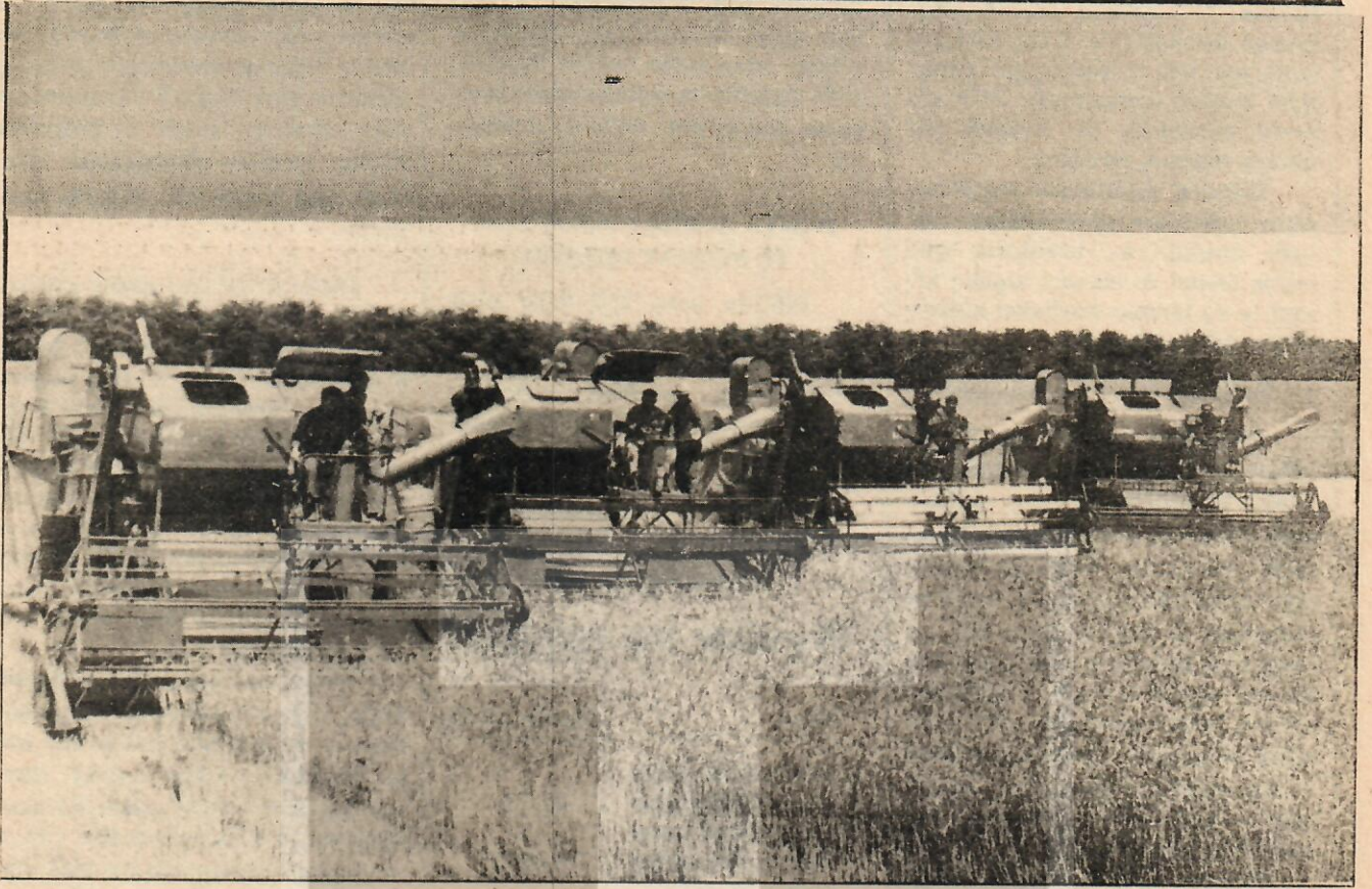
Devlet, buğday üretiminin artması yönünde özendirici önlemler almalıdır.