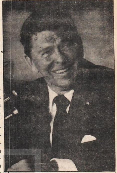
Reagan yönetimi, Amerikan çıkarlarına uygun davranan dikta rejimlerini "otoriter", uygun davranmayan dikta rejimlerini de "totaliter" sayıyor.

Güney Afrika Cumhuriyetinin koyu ve zalim bir ırkçı politika güden rejimini bile —kendi stratejik ve eko-